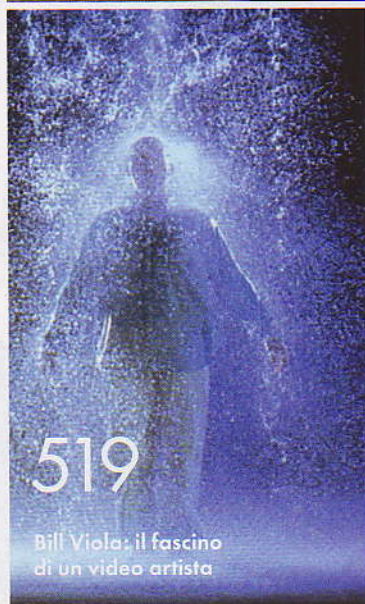
Bill Viola: il fascino di un video artista