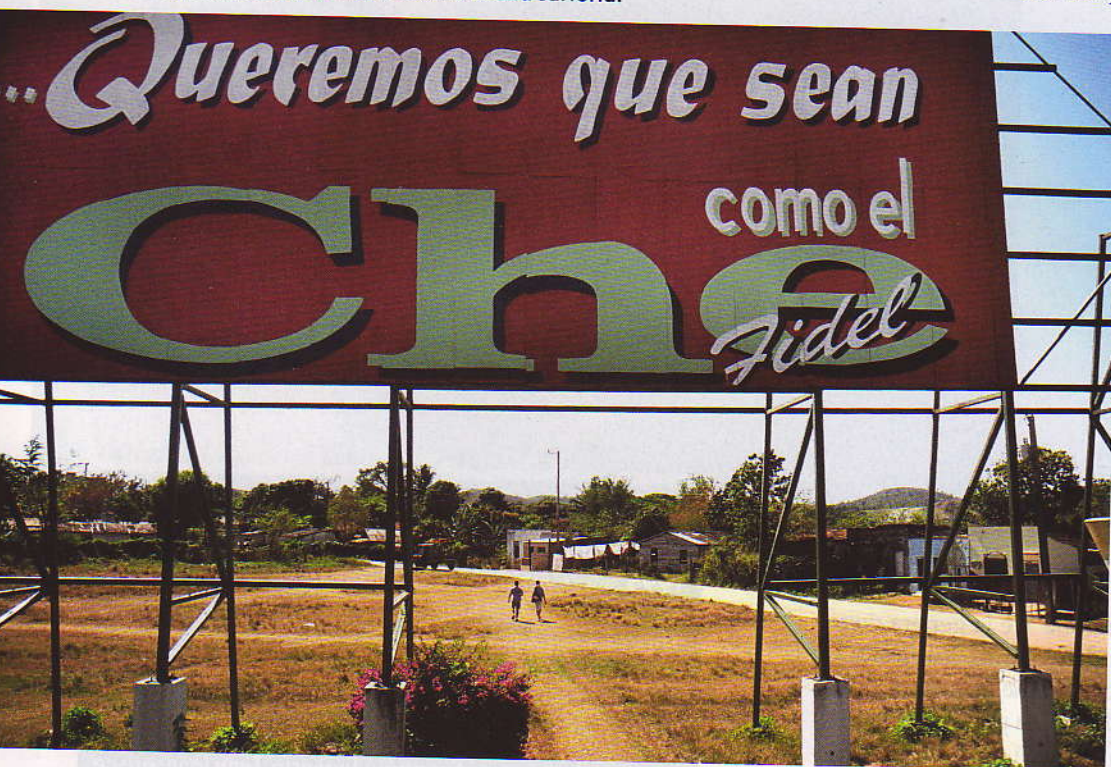
Un enorme cartellone davanti al monumento dedicato a Che Guevara. In basso. Donne al lavoro in una sartoria.

tenere un'agenda delle cose che vuole fare, perché c'è sempre un imprevisto a modificare i piani e, quando riusciamo a portare a termine qualcosa in un solo giorno, ci consideriamo soddisfatti. La fatica maggiore spetta a noi donne. Oltre a lavorare come operaie, impiegate o anche libere professioniste, ogni giorno ci dobbiamo trasformare in piccole maghe